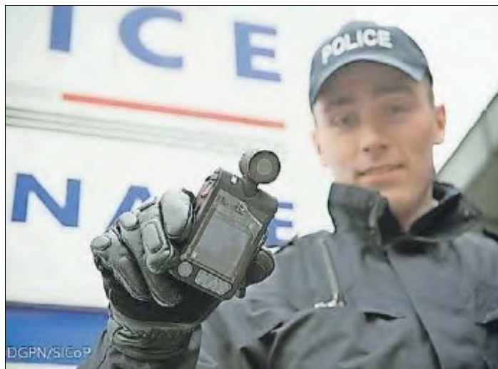
Minikameras: klein und handlich

Nach einem Bericht des Badischen Tagblatt vom 11.04.2013 wurde die Polizei in Mühlhausen mit drei Kameras ausgestattet, die den Bodycams entsprechen, die der Standpunkt im Rahmen einer Diskussion in der Mannheimer Öffentlichkeit bereits im Herbst 2012 vorstellte. Das französische Innenministerium testet derzeit